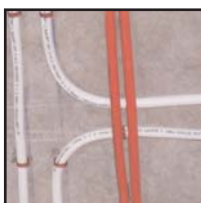
Siła tarcia pewnie utrzymuje zacisk Linian w otworze.

Zacisk Linian wykonany jest ze stali sprężynowej pokrytej powłoką odporną na korozję. Stal sprężynowa jest lekka, trwała i wytrzymałe temperatury do 510°C. Powłoka umożliwia zaciskowi przejście 500-godzinnej próby solankowej wg ASTM®-B117-9. Zacisk spełnia również wymagania BS6853: D8.3 1999 – środki ostrożności w projektowaniu i konstruowaniu pociągów pasażerskich; normę London Underground Limited 2-01001-001 Section 5.2.3 – Wymagania dotyczące emisji oparów toksycznych; i normę BS5839-1:2002 Punkt 26.2 dla kabli ognioodpornych.