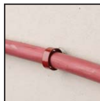
Wyciągnięcie zacisku wymaga średniej siły 107 N.