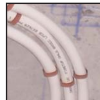
Zacisk Linian firmy ERICO montuje się 70% szybciej niż zaciski siodłowe.