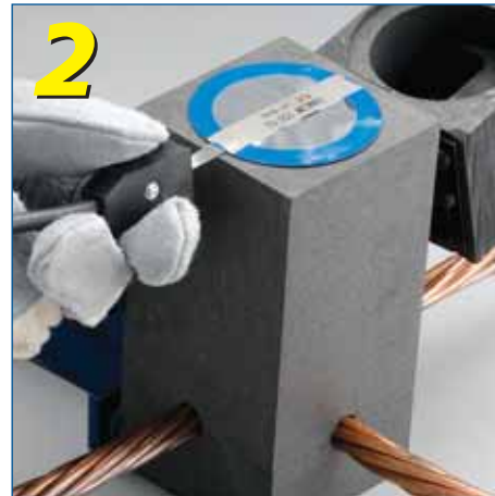
Liitä sytytinsytyksikön liitin jauhekupin liuskaan