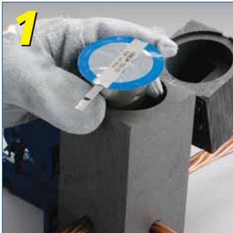
Laita CADWELD PLUS jauhepaketti muottiin