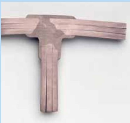
CADWELD molekyyliiitoksen elinikä sama kuin johtimien.