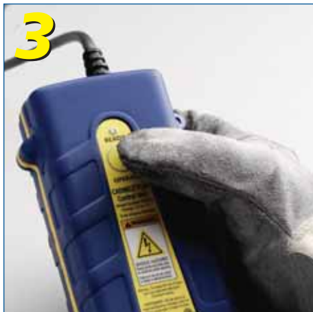
Paina nappia ja pidä painettuna kunnes sytytys on tapahtunut