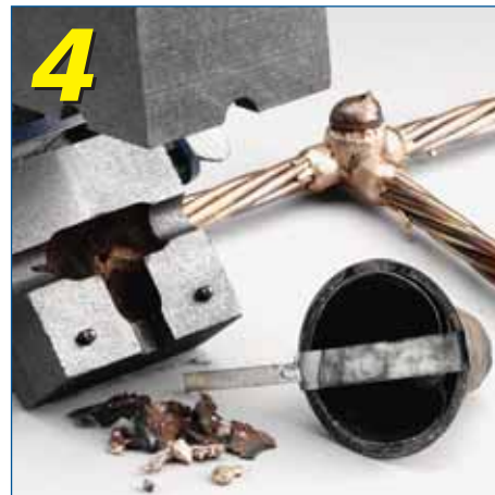
Avaa muotti ja poista jauhekuppi – muuta ei tarvita

CADWELD PLUS ohjausyksiköllä käynnistetään reaktio liitosjauheessa. Yksikössä on 1,8 metrin korkean lämpötilan kestävä johto varustettuna tarkoituksenmukaisella liittimellä.