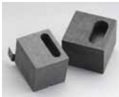
Baffle Cover Kit